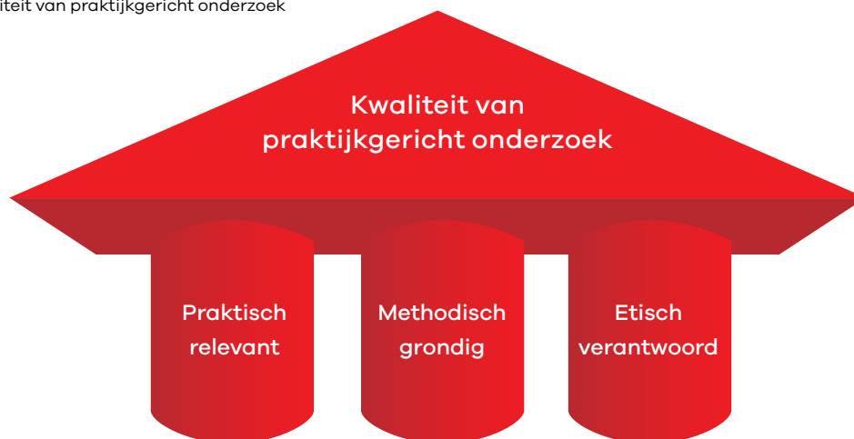
Figuur 1 Kwaliteit van praktijkgericht onderzoek

Daarna is gekeken op welk element van het onderzoeksproces een criterium betrekking heeft, zoals de onderzoeksvraag, het onderzoeksontwerp of de resultaten van het onderzoek. Dit leverde 9 elementen op (zie figuur 2):